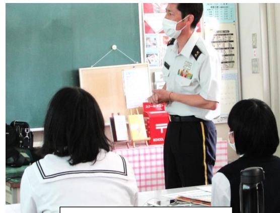
自衛隊員による説明会